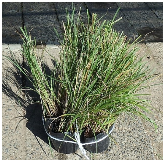
【結び目を除いて 1m縄目完成】